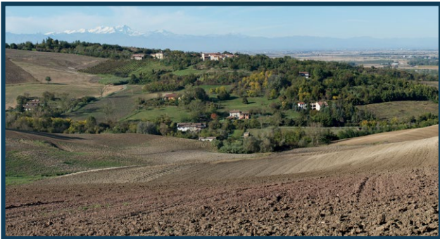
Veduta panoramica verso nord dalla strada Baldovina. Area mineraria relativa al territorio delle cascate Tessier, Canina, Faina, Bussola e Bussolotto. In alto al centro il borgo di Rolasco