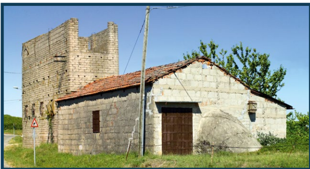
Piano inclinato ingresso miniera della Società Gabba & Miglietta