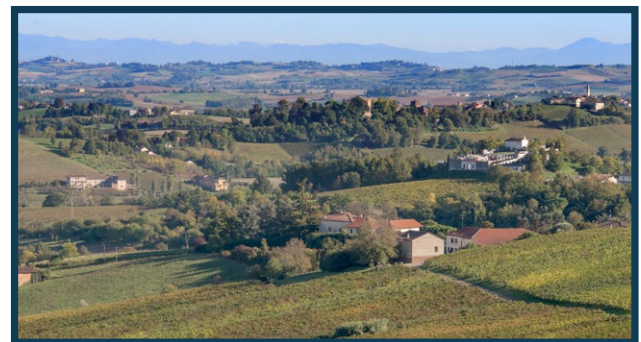
Il gruppo di case e i terreni relativi alla miniera Parona