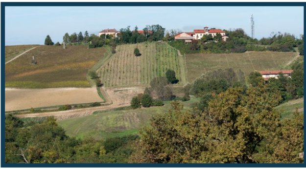
Veduta panoramica. In primo piano la vasta zona delle miniere Costamagna, Bigliona, Bosco dei Gattei e altre. In alto a sx la Cascina Migliavacca. Visibili i piloni della teleferica Bargerò che trasportava la marna dalla miniera Gattei all'opificio di Casale.