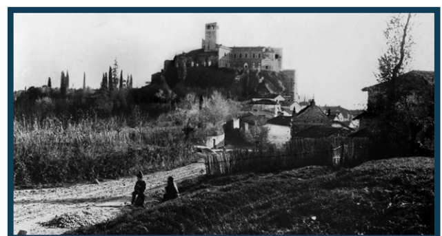
Foto storica della chiesetta di San Rocco vista dalla strada Costa (una "strada di polvere" allora ancora priva di abitazioni) in cui minatori e Sangiorgesi tutti si recavano a chiedere aiuto e consiglio a Santa Barbara