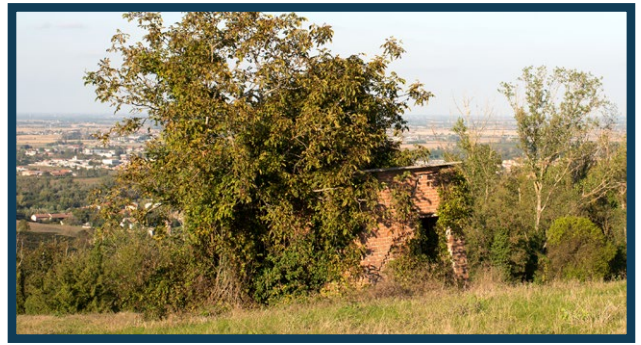
Sedime relativo alla cava di Cascina Rota - Cascina Berretta. Resti di un pozzo di aerazione della miniera Berretta completamente avvolti dalla vegetazione