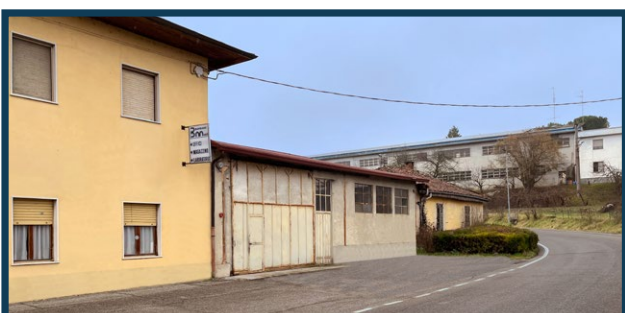
Sul sedime dell'attuale mobilificio Barbanò nasceva nel 1872 un complesso industriale per la produzione di calce (Fornaci di San Giorgio), successivamente passato nel 1874 alla Società Anonima Fabbrica di Calci e Cementi con sede a Casale Monferato