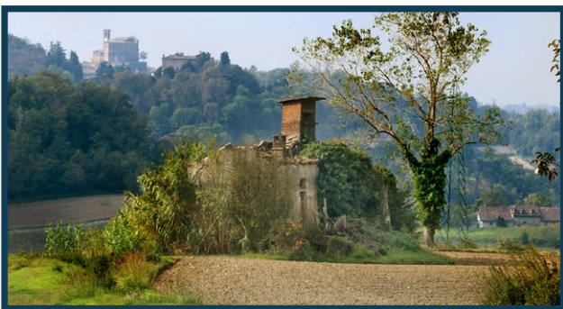
Resti di una presa d'aria della miniera Fornello e della stazione di carico della teleferica Milanese e Azzi